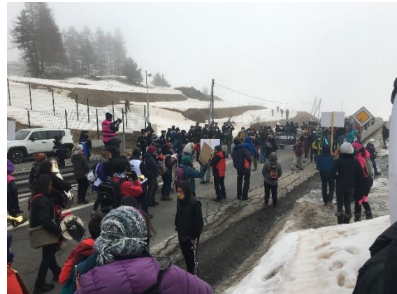
Französische und italienische Demonstrant*innen an der Grenze.