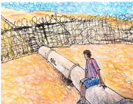
Zeichnung von Francesco Piobbichi

Wie unsere Schwesterorganisation Borderline Sicilia (BS) berichtete, befinden sich mit dem Ausbruch der Corona-Pandemie viele Migrant*innen auf Sizilien in einem Zustand der Unsichtbarkeit. Dieser Zustand beginnt bereits auf See. So wurde Mitte Februar nirgendwo von einem Schiffbruch mit mindestens vier Vermissten berichtet. BS wurde durch die hilfeschreitenden Anrufe von Verwandten, die nach ihren Angehörigen suchten, auf den Fall aufmerksam. Eine Antwort gab es nicht.