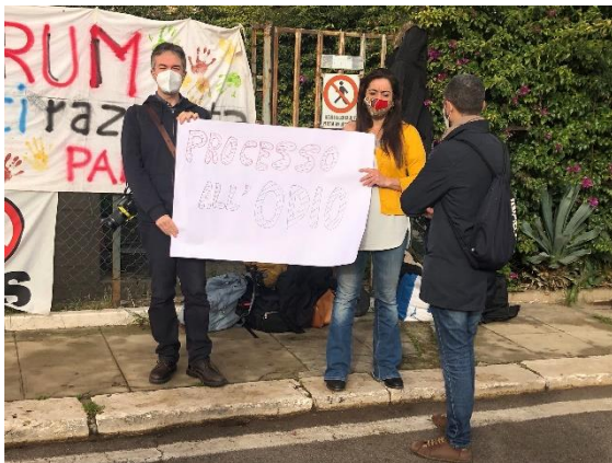
„Prozess gegen den Hass“, Anhörung Salvini 09. Januar 2021 in Palermo

Über die beiden Prozesse wegen Freiheitsberaubung, die gegen den ehemaligen italienischen Innenminister Matteo Salvini (Lega) laufen, haben wir bereits im letzten Streiflicht berichtet. Zur Erinnerung: 2019 wurde zwei Schiffen mit aus Seenot geretteten Menschen an Bord für jeweils mehrere Tage ein sicherer Hafen verwehrt. Durch das Festhalten an Bord wurde die Freiheit der Menschen beschnitten. Noch laufen die Vorverhandlungen für den Antrag auf Anklageerhebung gegen Matteo Salvini im Fall der Gregoretti (ein italienisches Küstenwachtschiff), in dessen Zuge am 19. Februar die Innenministerin Lamorgese und der Außenminister