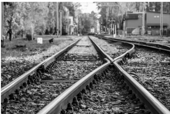
Weichenstellung in der italienischen Politik?

Einen knappen Monat nach dem Beginn der Regierungskrise in Italien schreitet die Bildung der neuen Regierung unter dem ehemaligen Eurobank-Chef Mario Draghi voran. Am 12. Februar wurden die Minister*innen und Staatssekretär*innen nominiert und fünf Tage später wurde die bereits im Senat gestellte Vertrauensfrage zu Draghi im Parlament wiederholt, um die Unterstützung der teilweise gegensätzlichen Parteien in der neuen Regierung zu sichern. Es handelt sich um eine gemischte technisch-politische Regierung. Technische Regierungen werden als nicht-politisch bezeichnet, da der/die Ministerpräsident*in sowie der Großteil der Minister*innen aufgrund ihrer fachlichen Kompetenzen – und nicht aus politischen Gründen – ausgewählt werden. Sie können zustande kommen, wenn eine politische Mehrheit nicht vorhanden ist, Neuwahlen aber verhindert werden sollen.